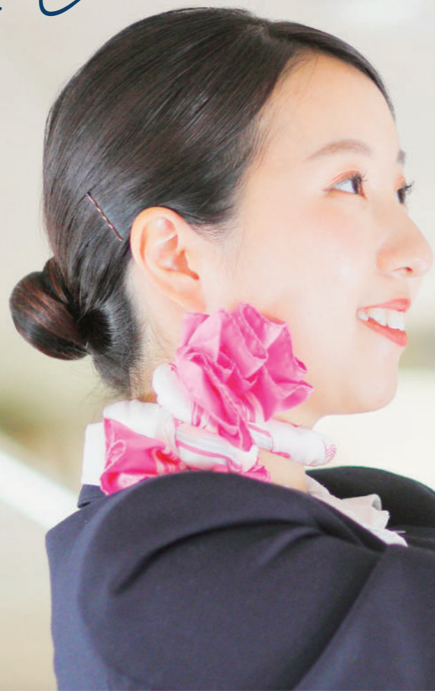
機内実習の授業風景

CA合格率 日本一! 卒業生の 約 30% は CA に! 約 70% は GS に!