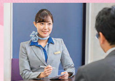
※撮影時のみマスクを外しています。

隣接するのと里山空港の飛行機を見ながら、いつも夢を叶えた自分を想像していました。学校生活ではTOEICの点数が思うように上がらない時、就活に行き詰まった時、先生や先輩が親身に相談に乗って全力サポートしてくださいました。時間を忘れるほど、勉強に集中できるころはこの学校のとても良いところだと思います。