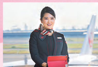
※撮影時のみマスクを外しています。

在学中は寮で生活しながら、アルバイト、語学留学、ボランティア活動など、さまざまなことに挑戦しました。経験を積むことにより見識が広がり、内面的にも成長できたように思います。また、卒業生の就職報告書や先生方からの力強いサポートも夢の実現につながりました。