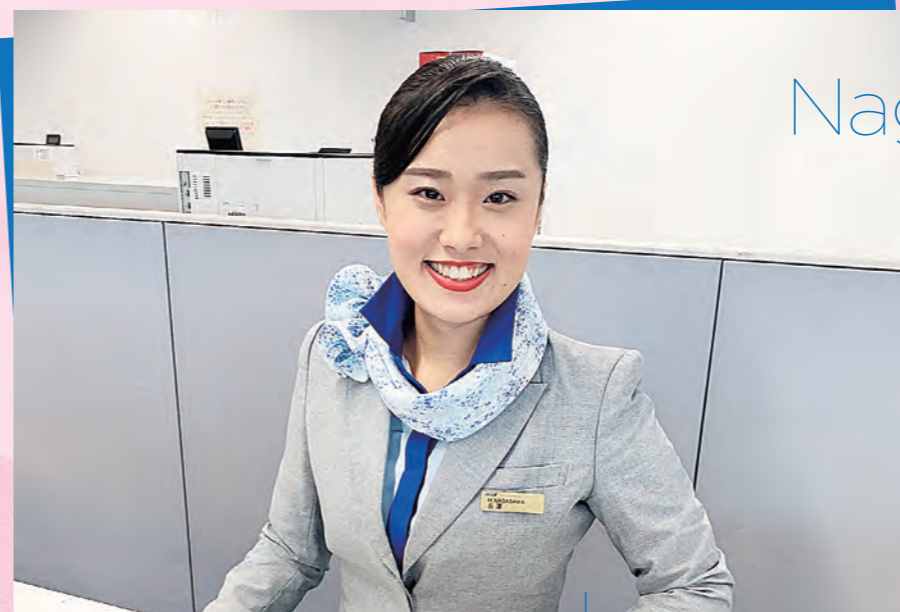
※撮影時のみマスクを外しています。

寮生活をしていると、就職活動に出かける時や帰ってきた時に友人に「行ってらっしゃい」「おかえり」と声をかけてもらえることが、とても心強く励みになりました。就活では様々な会社の企業研究にも力を注ぎました。第一希望の会社を目指しながらも、他の会社を知ること、希望の会社への気持ちも一層高まると思います。