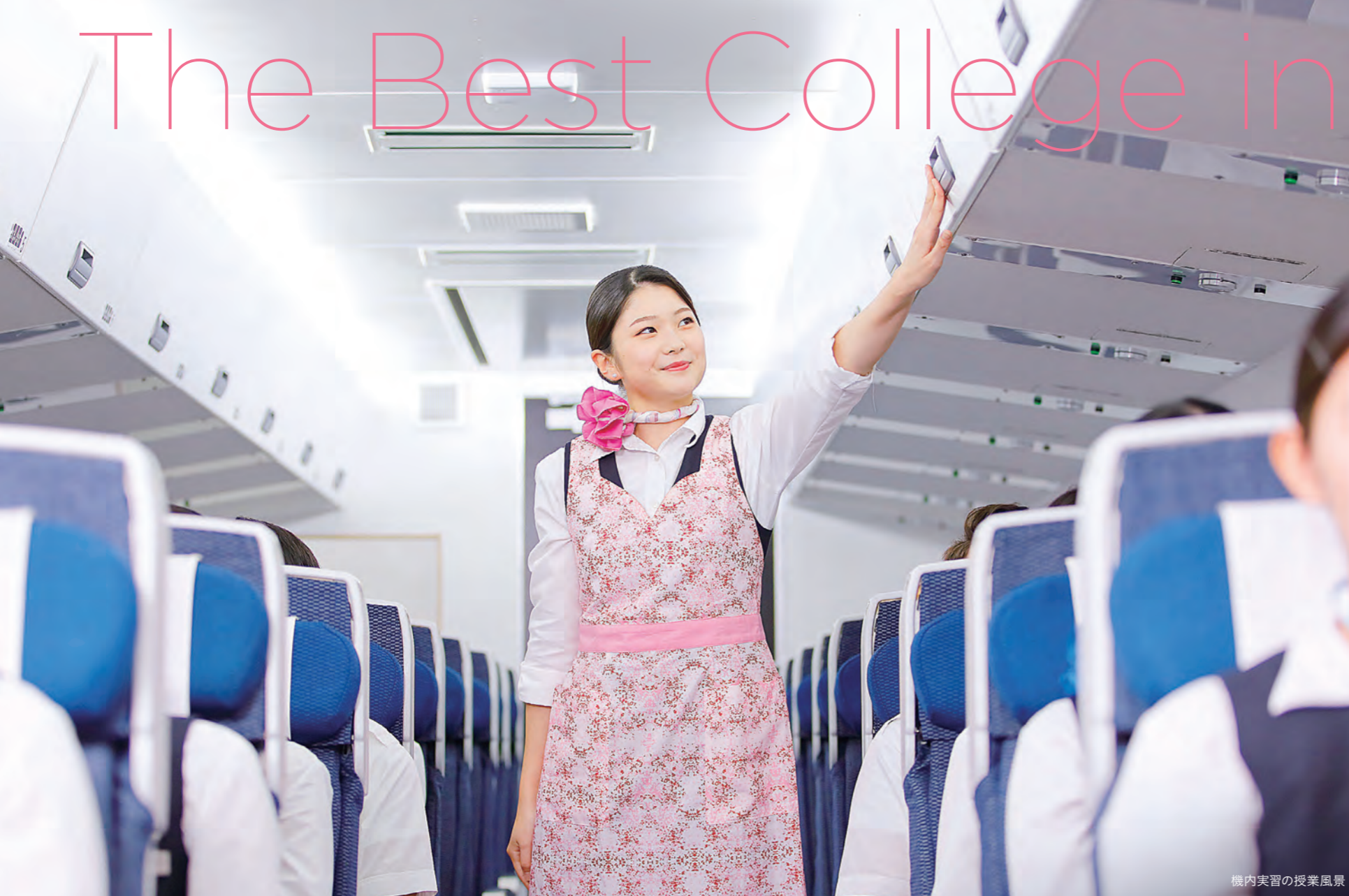
機内実習の授業風景