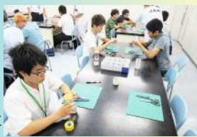
フロストグラス体験

「ものづくり」の基本的な技術を楽しく学びながら、フロストグラスを作ります。作品はお土産としてお持ち帰りOK！手先が器用な人に向いています。