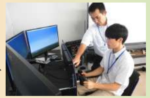
フライトシミュレータ体験

プロのパイロットになる方法、必要な資格について教員が詳しく解説します。フライトシミュレータ体験や、晴れていたなら小型機の体験搭乗も出来るかも！？