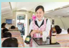
機内サービス体験

元大手客室乗務員やグランドスタッフが、CA・GSのお仕事や留学コースについて説明します。参加者には特別に、難関CA・GS受験合格の秘訣をお教えます！