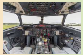
コックピット見学

大型機 YS-11 のコックピットに入ったり、実際の航空機整備を在校生と一緒に見学・体験できます。航空整備士の資格や仕事内容についても詳しく解説します。