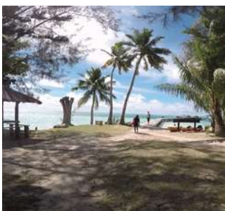
国内外リゾート企業

水中映像関連企業 / 水中土木関連企業 / 国内リゾート企業 / 海外リゾート企業 国内ダイビング企業 / 海上保安庁 / 消防 / 自衛隊 / 警察 / 漁業協同組合など